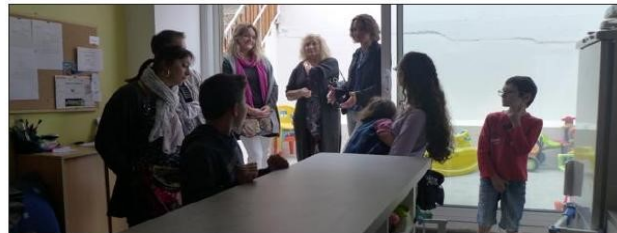
■ La cuisine de la Maison d'assistantes maternelles donne sur la terrasse et le jardin.