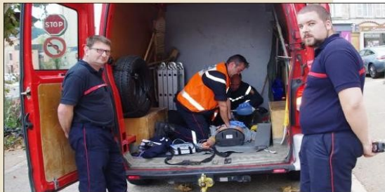
■ Ce n'était qu'une manœuvre, mais très réaliste.

Jeudi, à 12 h 30, un homme est inconscient sur un banc, place de la Bascule. Il est rapidement secouru par les pompiers qui le prennent en charge. Ils lui font un massage cardiaque avec l'aide d'un défibrillateur.