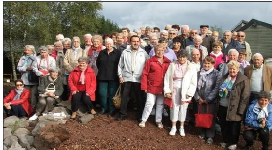
■ Les visiteurs du Club, les pieds sur la pouzzolane extraite du volcan de Lempdegy.

Vendredi, ils étaient 80 passagers à embarquer dans deux cars, pour le voyage surprise annuel du Club de l'Amitié. Malgré le mystère bien gardé, quelques idées fusaient çà et là lorsque les cars prirent la direction de l'Auvergne. Le président en donnant des indices a permis à certains de comprendre que le thème de cette journée était les volcans. Le premier arrêt à Volvic le confirmait : visite de la grotte où la pierre grise a été extraite, aux XIX e et XX e siècles. À Lempdegy, où un repas attendait les voyageurs, la journée se poursuivait par la visite du volcan à ciel ouvert du même nom. Un petit train était mis à disposition parsemé de commentaires sur la naissance et l'évolution des volcans, il y a 30 000 ans. Ensuite, la projection de deux films en 3D retraçait les bouleversements de cette époque. Parmi les spectateurs l'angoisse était palpable quand leurs sièges bougeaient au rythme des explosions et tremblements de terre. Une journée qui laissera de beaux souvenirs à tous les participants.